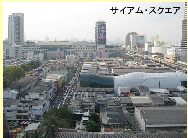
サイアム・スクエア