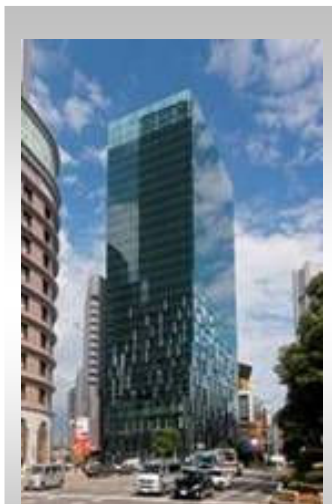
<大阪富国生命ビル>

今後におきましても、駐車場を通じて施設の付加価値の向上につながるよう、ホスピタリティの高い駐車場サービスの提供に努めてまいります。